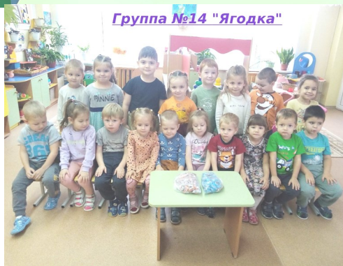
Группа №14 "Ягодка"