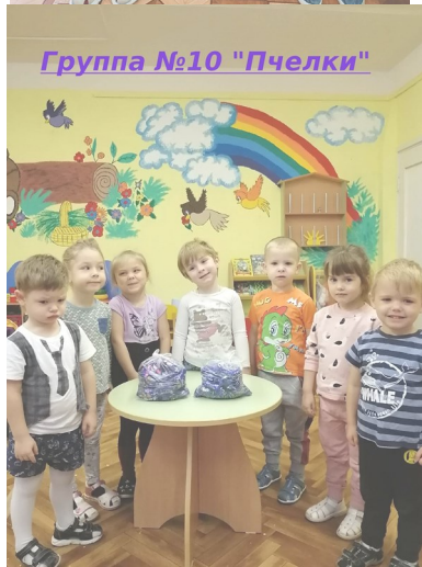
Группа №10 "Пчелки"