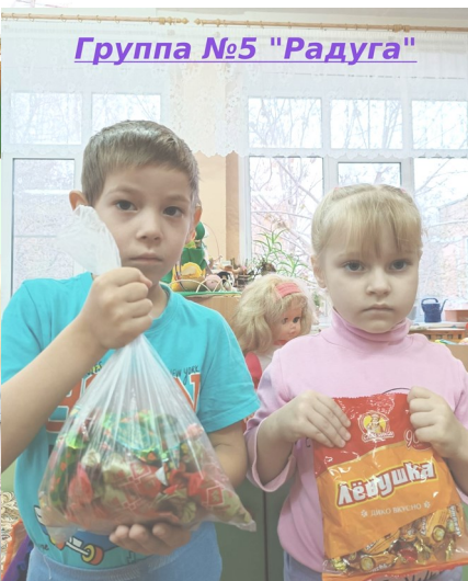
Группа №5 "Радуга"