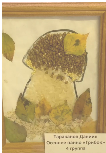
Тараканов Даниил Осеннее панно «Грибок» 4 группа