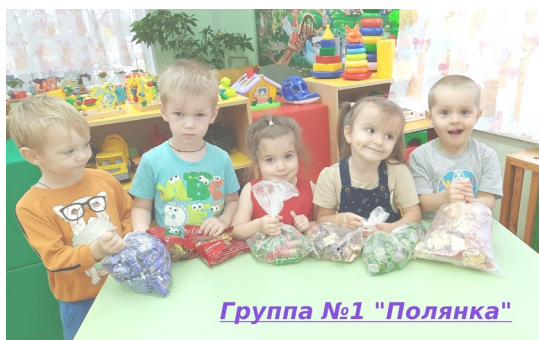
Группа №1 "Полянка"

Спасибо огромное всем кто откликнулся! Пусть ваши дела приносят благо и радость!!! 🙏🙏🙏