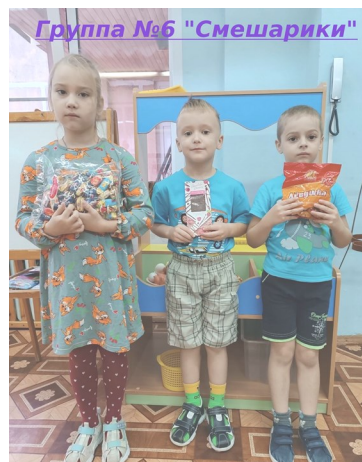
Группа №6 "Смешарики"